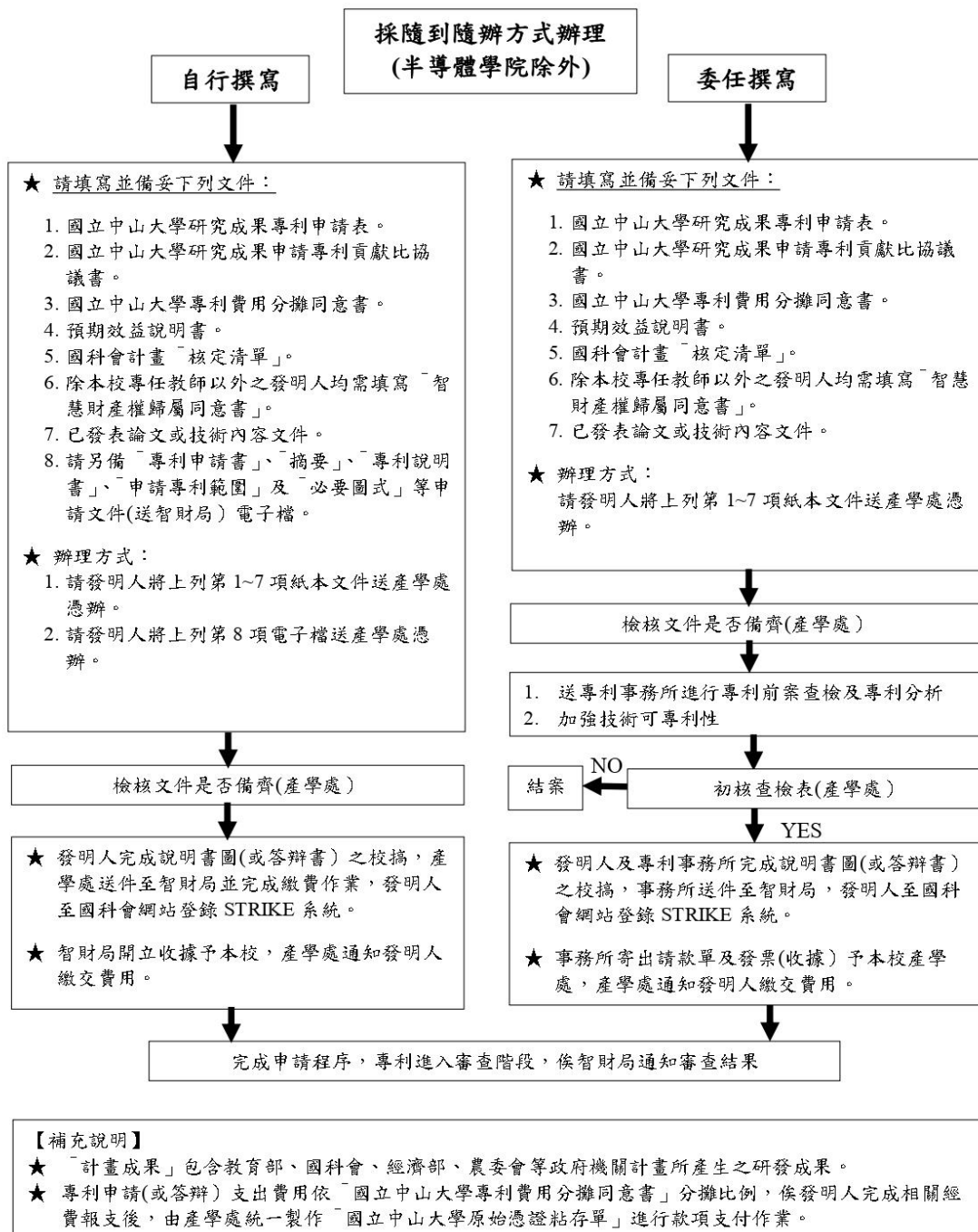
圖 1 國科會計畫成果申請國內專利流程